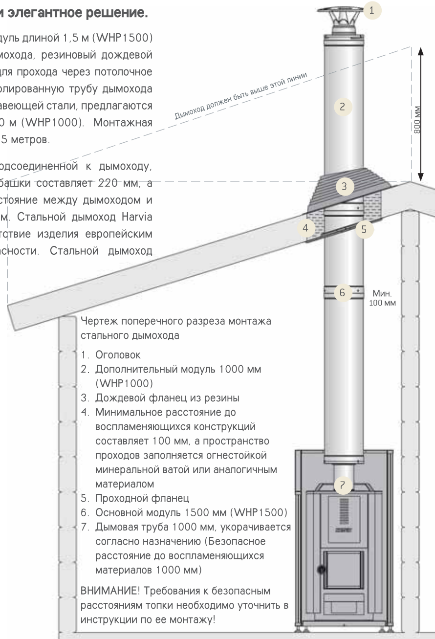
Чертеж поперечного разреза монтажа стального дымохода